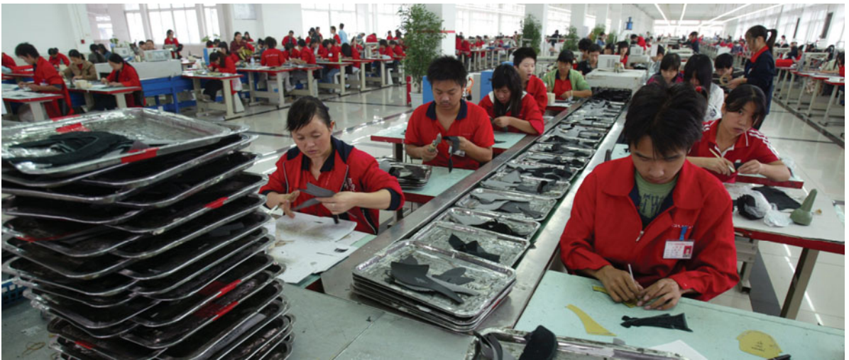
Interior de una fábrica China

AsiaInspection cuenta con 350 inspectores, que gozan de una gran experiencia y que están preparados para realizar controles de calidad y auditorías en cualquier fábrica del continente asiático en tan solo 48 horas, y entregar informes detallados en el mismo día.