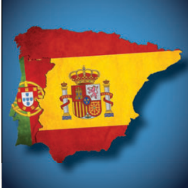
Ilustração de capa: Telma Ferreira